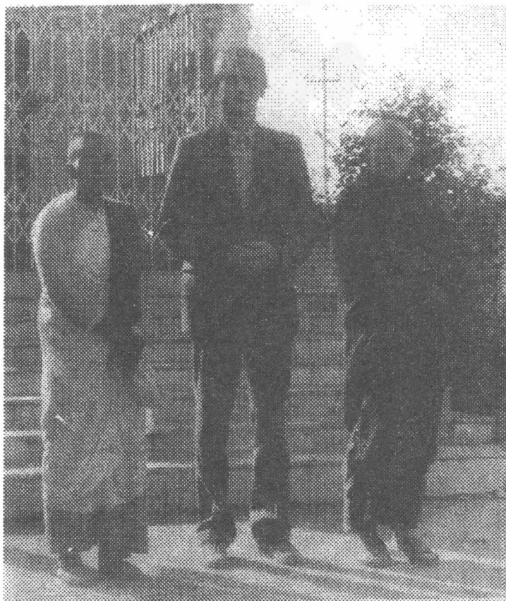
На фото: Новые друзья — монахи из Мьянмы.