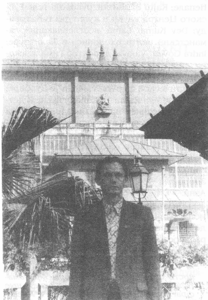
На фото: В столице Непала — Катманду.