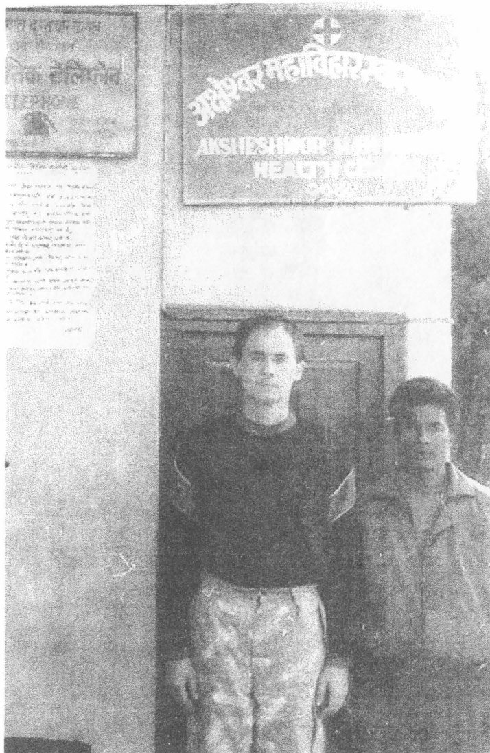
На фото: В центре аюрведической медицины.