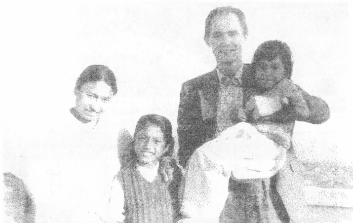
На фото: В семье буддистов Махаяны.