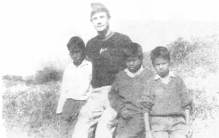
На фото: Дети Гималаев.