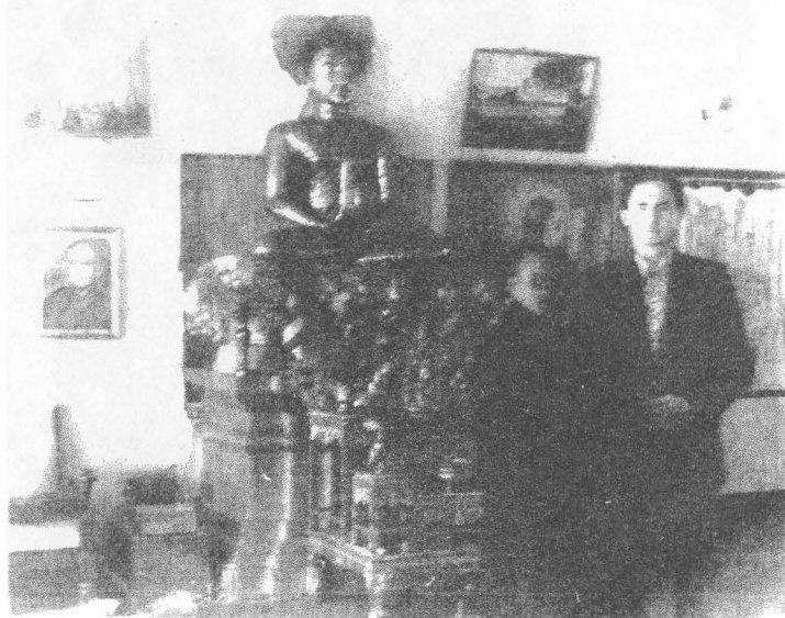
На фото: У священного алтаря буддистов Хинаяны.