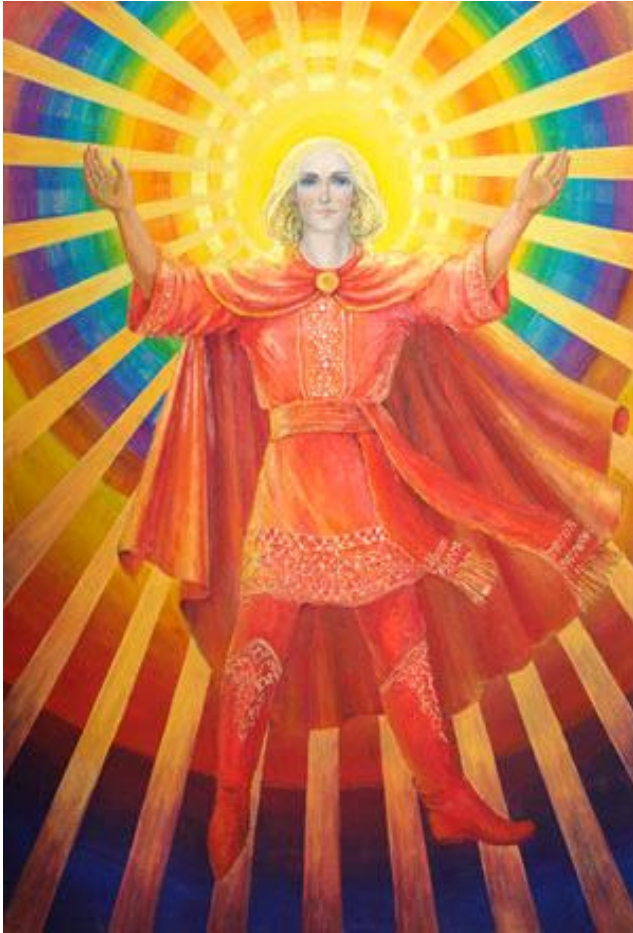
Н.Т.Кукель. Дажьбог – Бог Солнечного Света, Праотец Русских.

широта души, открытость к восприятию новых идей и их воплощению в жизнь, внутренняя потребность к справедливости и свободе, космизм и солнечность, почитание Света.