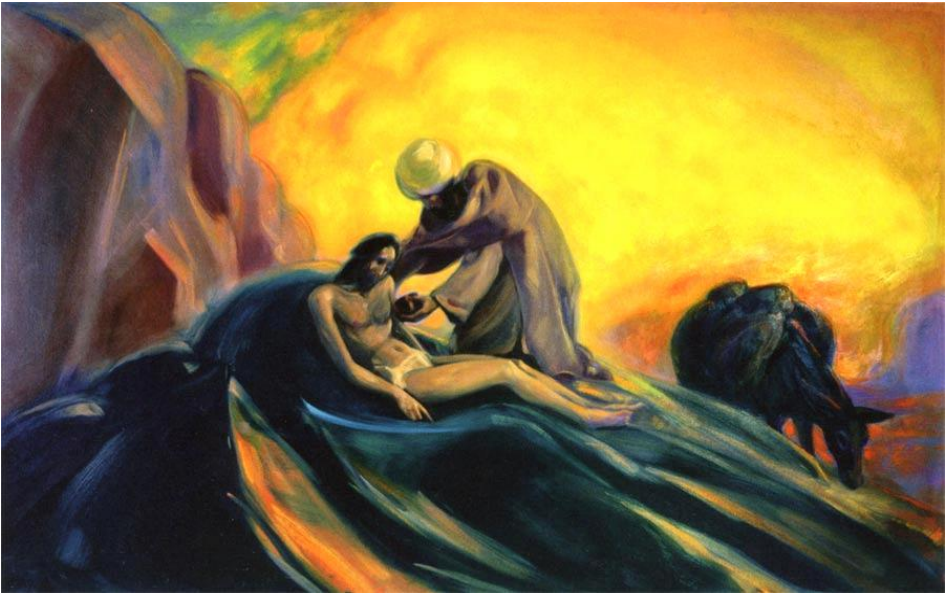
Картина С.Н.Периха «Добрый самаритянин».

Поступки человека, направленные на достижение данной цели, из обыденного самовыражения или самоутверждения трансмутируются в выражение и утверждение себя как частицы космического целого. Здоровье такого целого зависит от здоровья каждой составляющей его единицы.