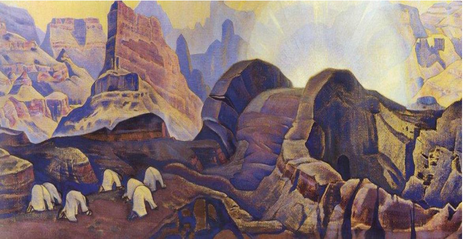
Картина Н.К.Вериха «Чудо. Явление Учителя».

Сказано: чудеса бывают в жизни любовью и устремлением.