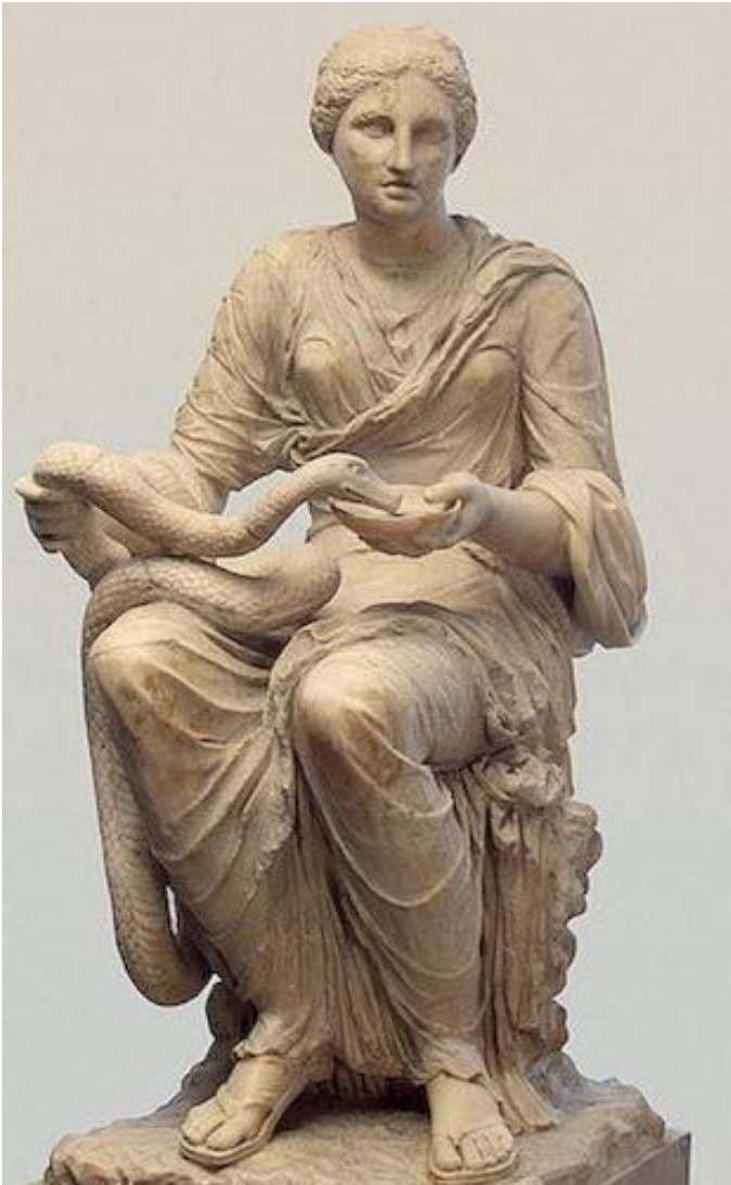
Статуя Гигии (Эрмитаж).

жизнедателю Зороастру. Тот, кто мыслит о свете, неминуемо приходит к единому Свету.