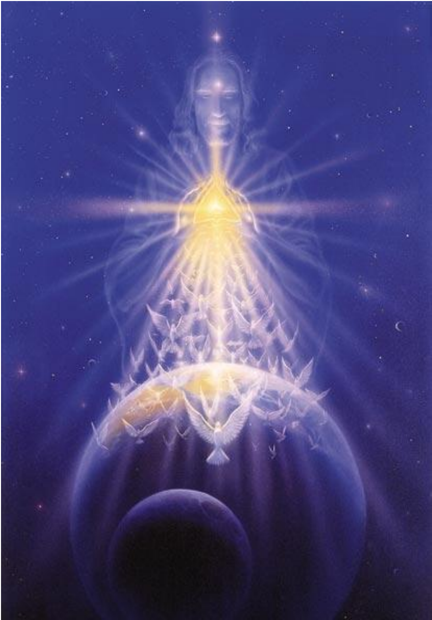
Дух возносящие... (Энергопоток).