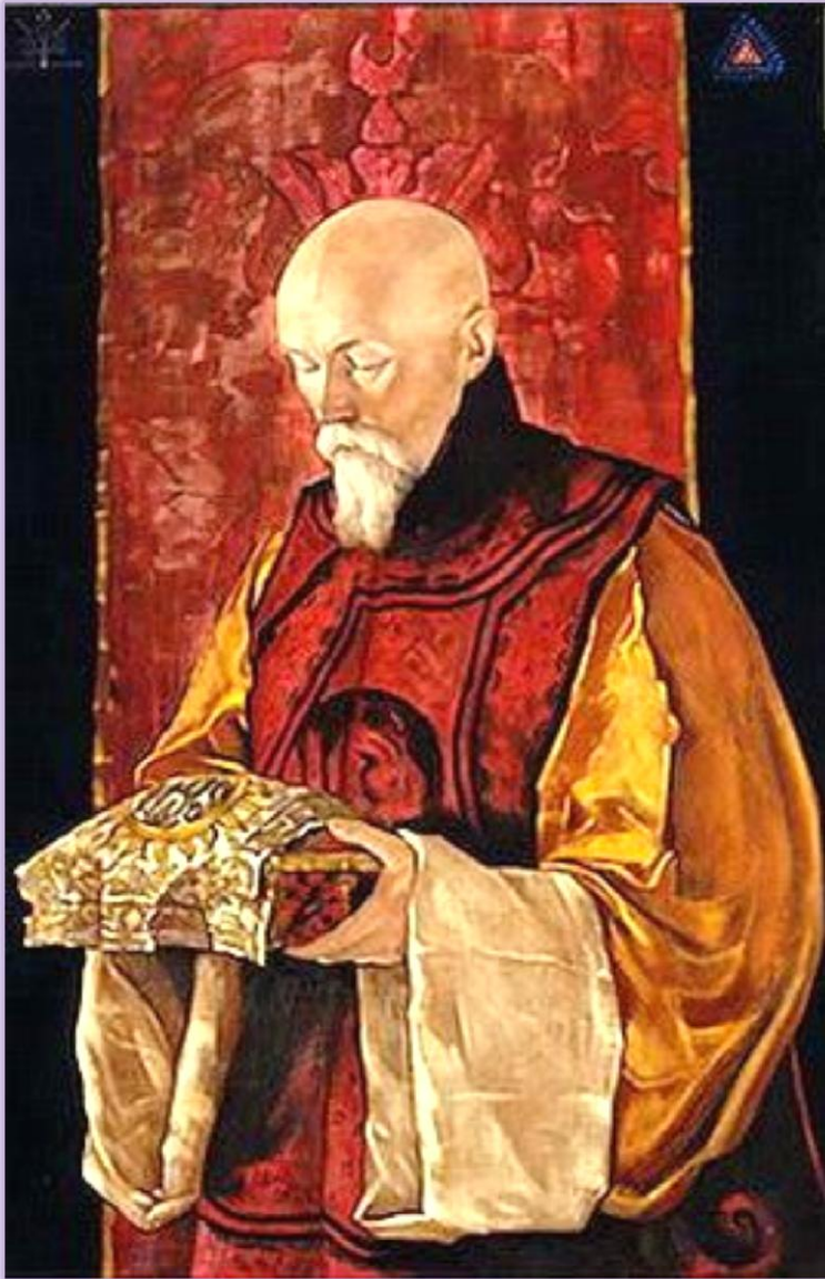
Портрет Н.К.Рериха кисти Святослава Рериха.

спокойствие и следите за здоровьем. Приучайте себя к торжественному настроению. Помните о мудрой радости. Фразу радость есть особая мудрость любил повторять и Н. К. Рерих.