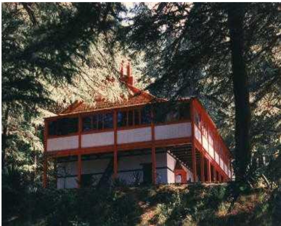
Институт гималайских исследований «Урусвати».

Ссылаясь на труды великого русского учёного академика В. М. Бехтерева, Николай Константинович в известной своей статье Парапсихология указывал следующее: будет ли парапсихология, будет ли наука о мысли, будет ли психическая энергия открыта, ясно одно — эволюция устремляет человечество к нахождению тончайших энергий. Непредубеждённая наука устремляется в поисках за новыми энергиями в пространство — беспредельный источник всех сил и всего познания. Наш век есть эпоха энергетического мировоззрения.