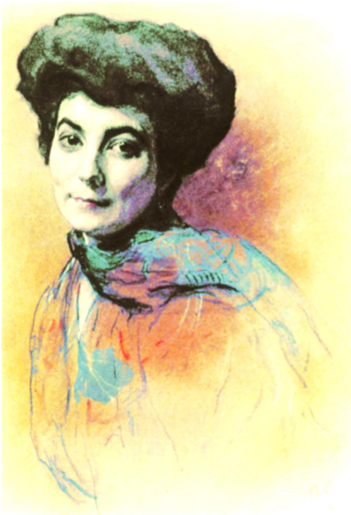
Валентин Серов. Портрет Елены Рерих.

миссии Рериховской семьи, жизнетворческом подвиге. Вникнув в его суть, откроем сердца навстречу Огню, возожжённому Е. И. Рерих.