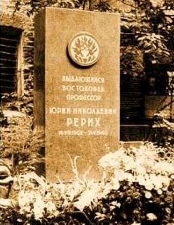
Памятник на Новодевичьем кладбище.

Агния наводит порядок, но не может дотянуться до верхушки обелиска.