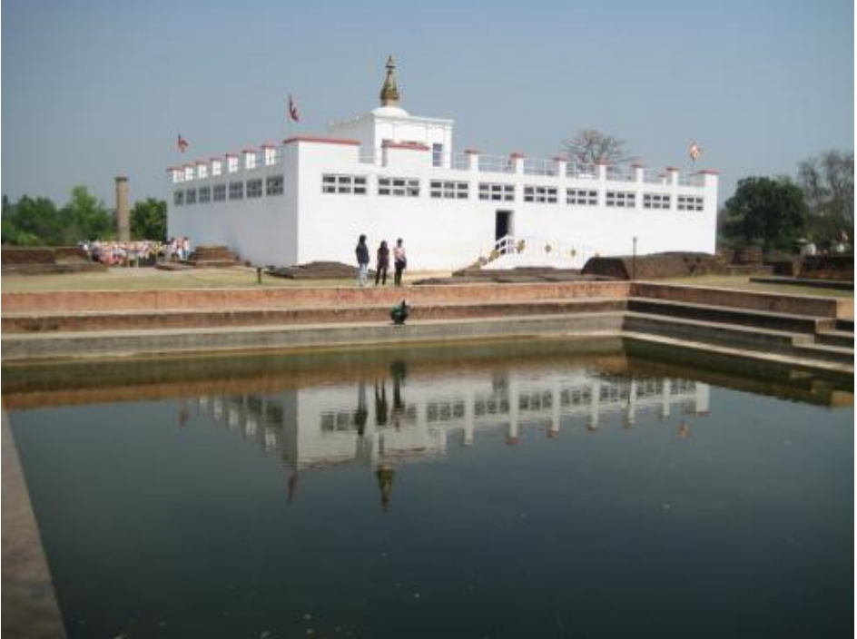
Лумбини — место рождения Будды.

при храме навсегда и работать с паломниками-европейцами. Он помнит Рерихов, сожалеет, что Джордж в былые времена отказался от выгодного места в иерархии монастырских чинов.